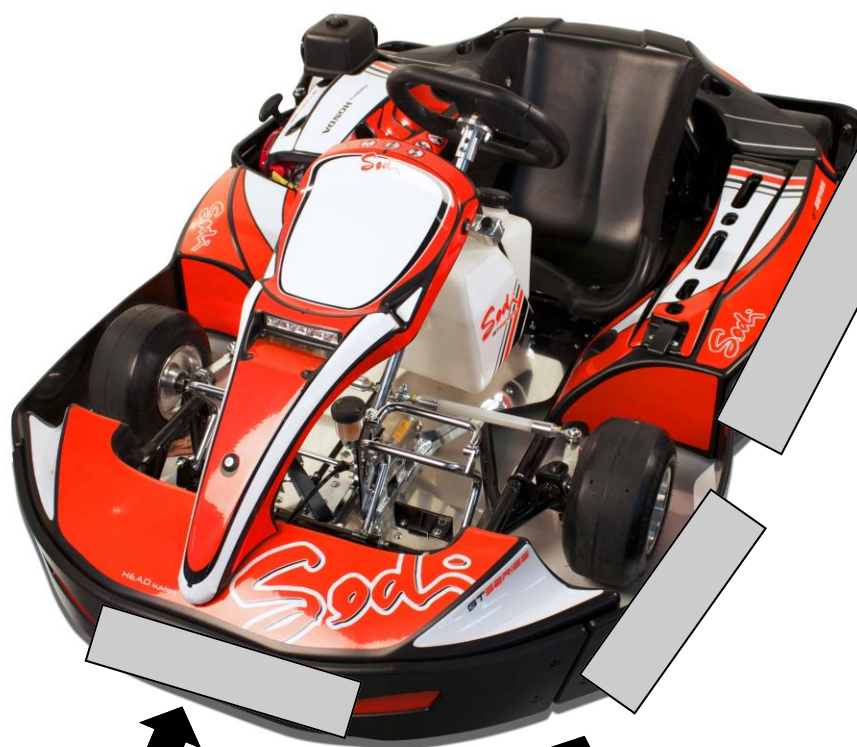
AFFICHAGE AVANT 35cm x 7 cm