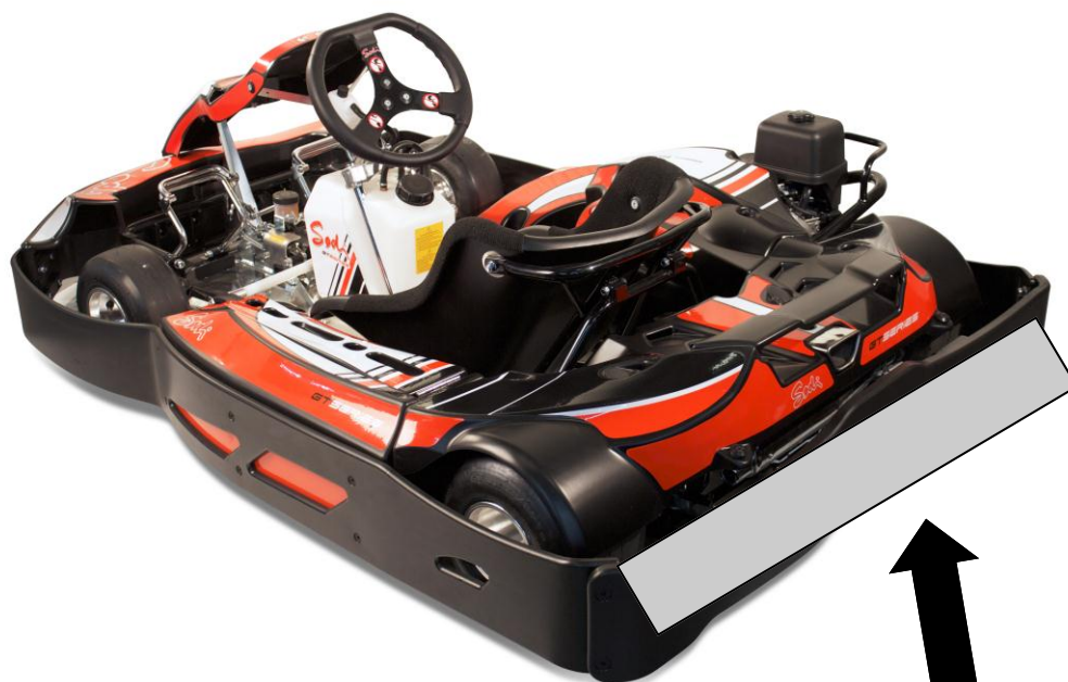
AFFICHAGE ARRIERE 92cm x 16.5 cm